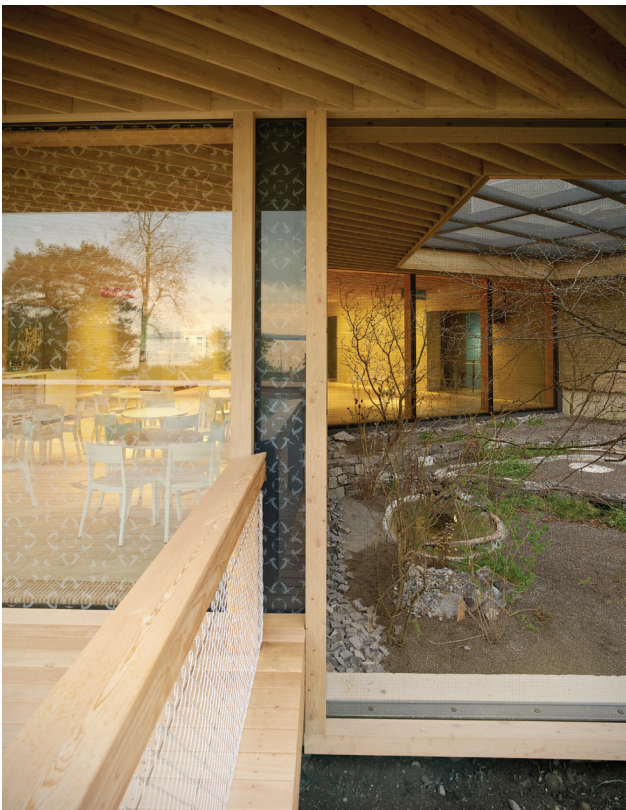
Foyer mit Schauviere