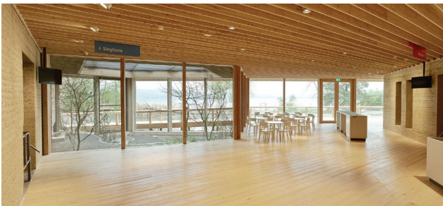
Foyer mit Schauviere